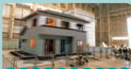
実大振動実験で震度7相当をクリア